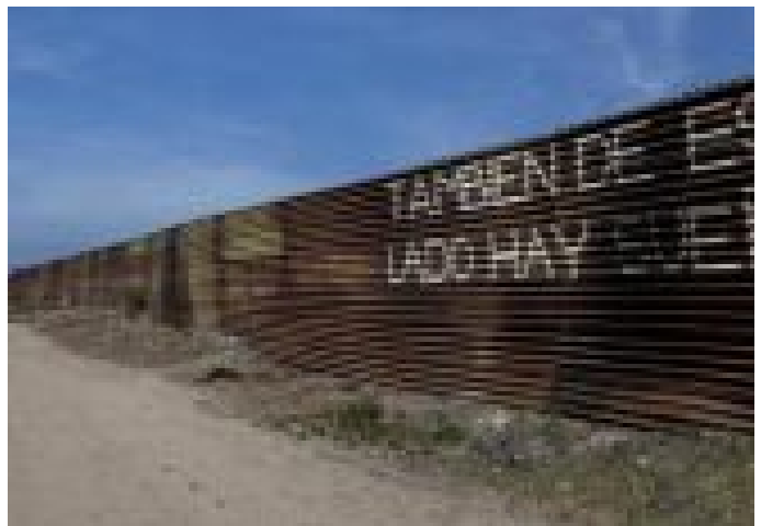
ARIZONA Y TEXAS ALISTAN DESPLIEGUE EN LA FRONTERA