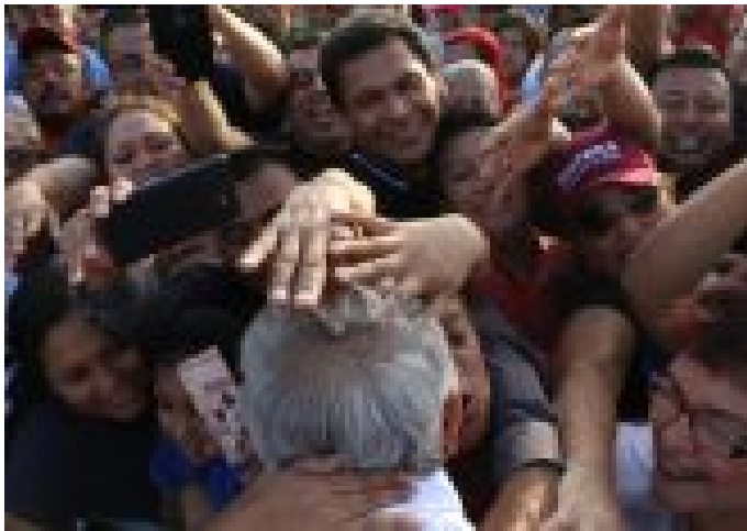
EL BONO DE AMLO: ALEJANDRO PÁEZ