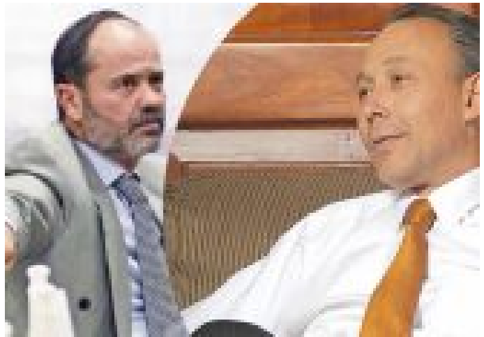
TORRE FUERTE: EL 'BATO' VS EL 'HUEVOS TIBIOS'