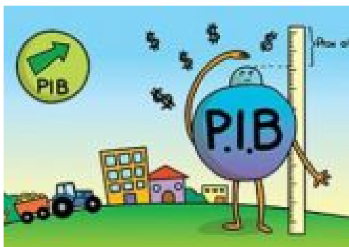
EL CRECIMIENTO DEL PIB CON EPN CERRARÁ EN 2.5%