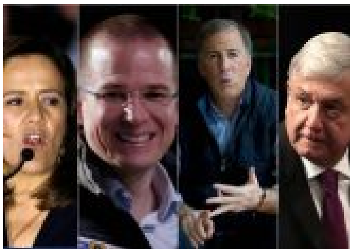
MEADE RETA A AMLO Y A ANAYA, A DEBATIR SU PATRIMONIO