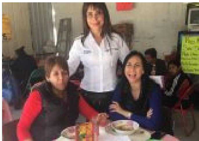
'PEGADORA' CUMBIA DE LA CANDIDATA